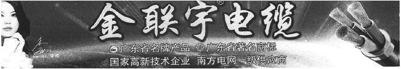
450/750V铜芯交联、无卤低烟电线